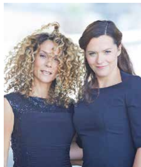
Duo Pariser Flair am 21. Juni