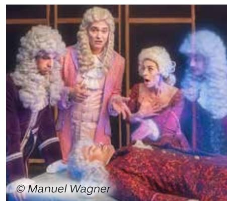
Badische Landesbühne am 22. Juni