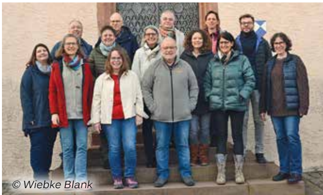
Foto: Das „Spiekeroog-Cœurchen“ musiziert im Festgottesdienst und gestaltet in diesem Jahr die kirchenmusikalische Matinee.

Am Sonntag, 21. Juni , wird in Dittigheim in der Pfarrkirche St. Vitus das Patrozinium des Schutzheiligen begangen. Der Festgottesdienst beginnt um 10 Uhr und wird musikalisch neben dem Singkreis Dittigheim auch durch das „Spiekeroog-Cœurchen“ mitgestaltet. Die 13-köpfige Band, die sich aus Mitgliedern zusammensetzt, deren Wohnorte zwischen Limburg und Nürnberg verstreut liegen, gestaltet im Anschluss an den Gottesdienst eine kirchenmusikalische Matinee. Im Nachgang sind alle Besucher auf den Rathausplatz zu geselligem Beisammensein bei Speis und Trank eingeladen.