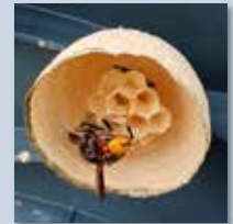
Embryonalnest nur mit Königin (März - Mai)