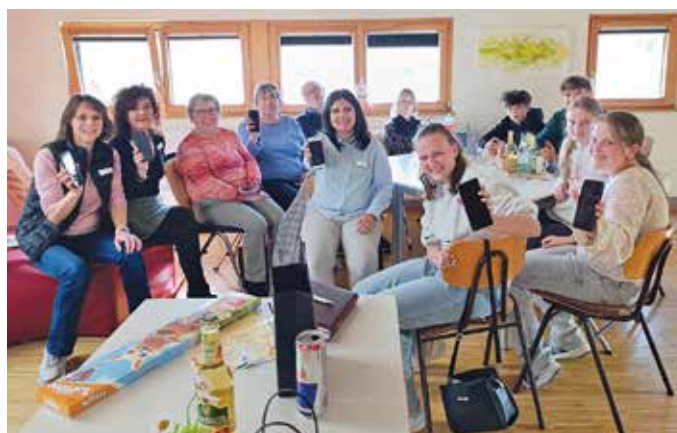
Strahlende Gesichter bei jung und alt für die geglückte Einführung in Geräteeinstellungen und verschiedene Apps auf dem Smartphone von Besuchern des Familienzentrums in Grünsfeld-Wittighausen und den Jugendlichen aus dem Jugendhaus Tauberbischofsheim