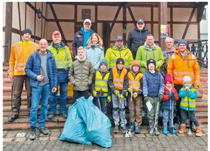
Picobello in Hochhausen